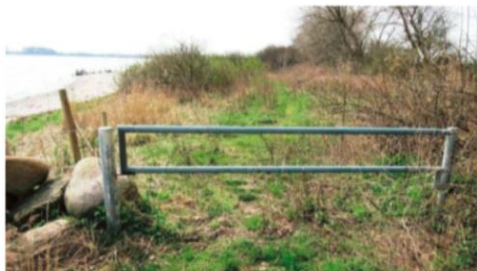
Friluftsrådet oplever, at flere danskere bliver smidt væk fra strande af grundejere, som gør alt, hvad de kan, for at holde offentligheden væk.