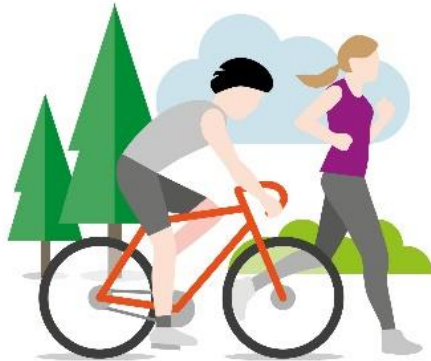
Bevægelse i naturen