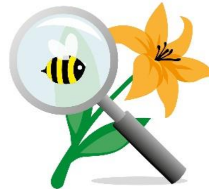
Nye vinkler på naturformidling