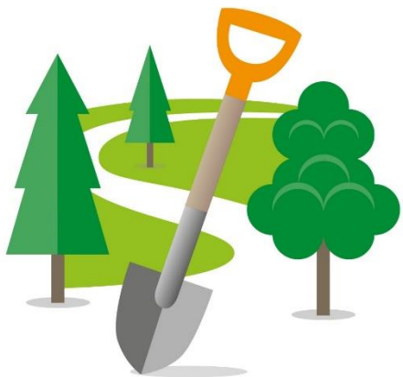
Rammer for frivilligt engagement