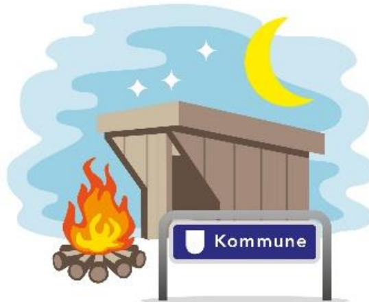
Friluftsliv lige i nærheden