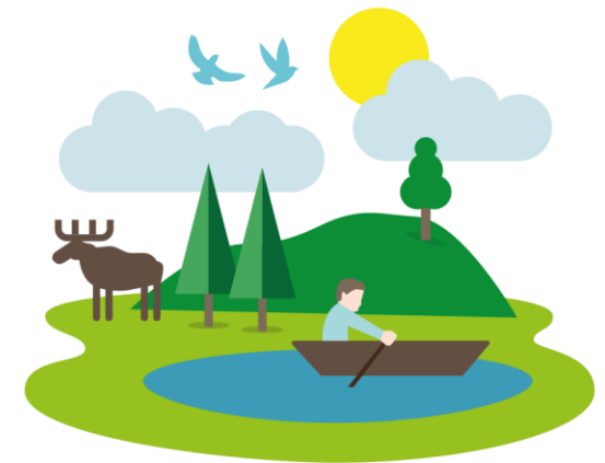
Udvikling af naturparker og nationalparker