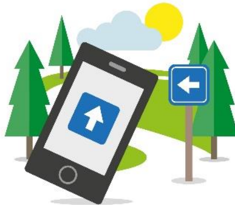
Bevægelse i naturen